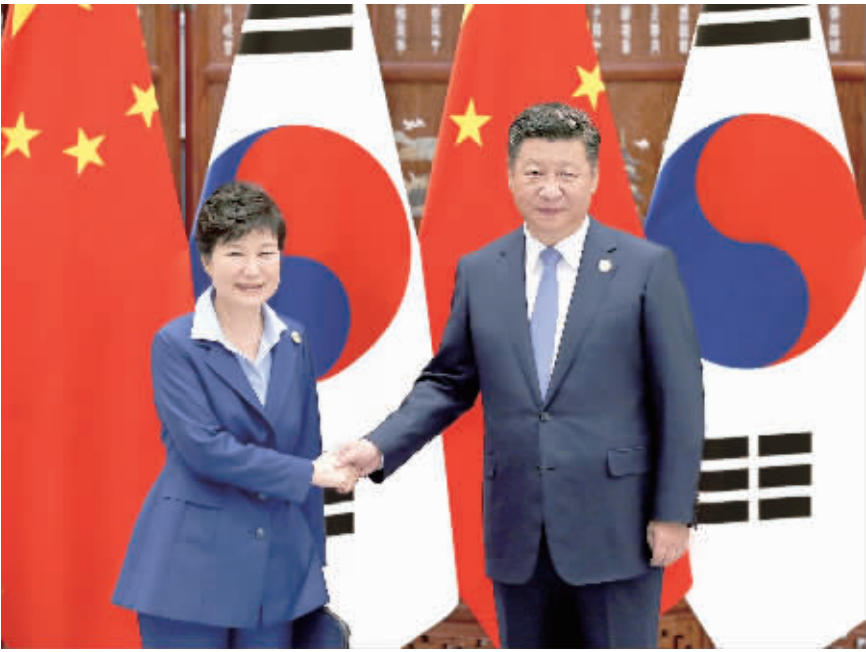
9月5日，国家主席习近平在杭州会见来华出席二十国集团领导人峰会的韩国总统朴槿惠。

朴槿惠表示，很高兴来到在韩中关系史上有重要意义的杭州见到习近平主席，当前两国关系正按照两国元首确定的方向高水平发展，并带动了地区繁荣。发展韩中友好是大势所趋。韩方高度重视对华关系，致力于深入推进基于互信的两国关系。双方要以明年韩中建交