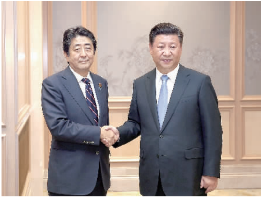
9月5日，国家主席习近平在杭州会见来华出席二十国集团领导人峰会的日本首相安倍晋三。

在谈到中日合作时，习近平指出，中日两国经济互补性强，双方可以加强宏观经济政策沟通，提高各领域务实合作水平，弘扬民间友好传统，推进地方交流。双方应该按照合作共赢的新理念，共同推进区域合作，应对全球性挑战。