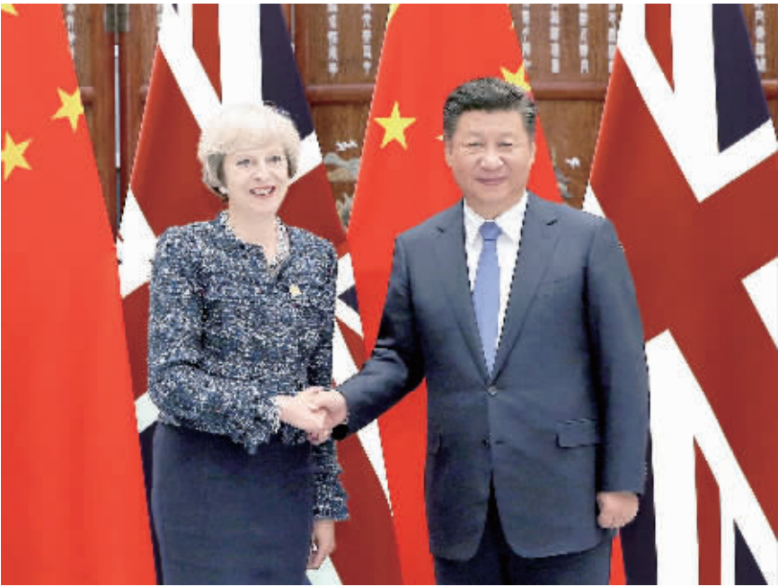
9月5日，国家主席习近平在杭州会见来华出席二十国集团领导人峰会的英国首相特雷莎·梅。

习近平强调，中英双方要保持高层交往势头，继续办好高层对话机制，加强战略沟通和统筹规划，不断深化相互了解和信任。继续推进经贸投资、能源、基础设施建设、金融等重点领域务实合作，拓展城镇化、高新技术、清洁能源等新兴领域合作，深化文化、教育、卫生、体育、青年、媒体等交流，积极探索建立执法合作机制，继续推进在反腐败和追逃追赃领域合作。加强在国际热点问题和联合国、二十国集团、亚洲基础设施投资银行等框架内合