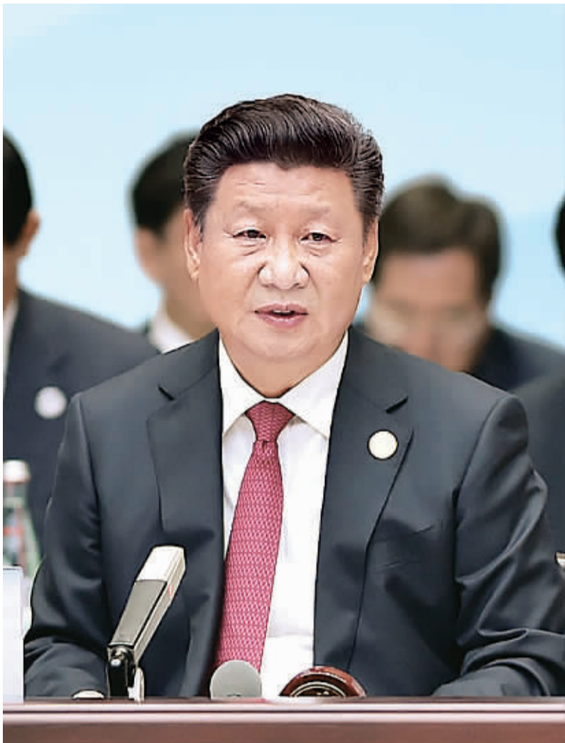
9月4日,二十国集团领导人第十一次峰会在杭州国际博览中心举行。国家主席习近平主持会议并致开幕辞。

该坚决避免以邻为壑,做开放型世界经济的倡导者和推动者,恪守不采取新的保护主义措施的承诺,加强投资政策协调合作,采取切实行动促进贸易增长。我们应该发挥基础设施互联互通的辐射效应和带动作用,帮助发展中国家和中小企业深入参与全球价值链,推动全球经济进一步开放、交流、融合。