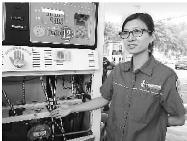
在位于东莞市东城区莞莞路附近的东海一加油站，正在举行中国石化公众开放日活动。工作人员详细为参观者介绍加油机的构造和工作原理和油气回收装置...