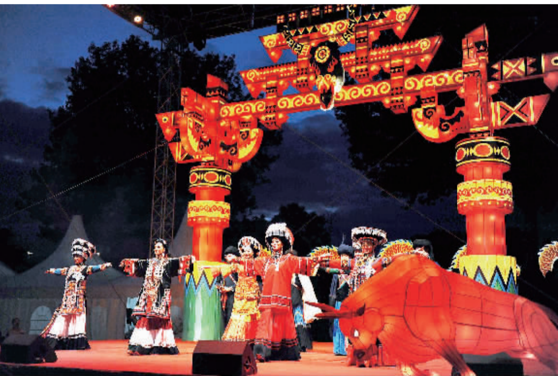
近日,由四川省人民政府和四川省海外交流协会主办,成都远宸时代文化传媒股份有限公司承办的“文化中国,锦绣四川”国际彩灯节在奥地利维也纳开幕。

文章说,比亚迪在1995年成立的时候只是家生产手机电池的工厂,但现在却成了一家研发和生产新能源汽车的工厂。他们生产的电动叉车在澳大利亚也很有名。深圳华大基因研究院于1999年建立,现在已经是全球最大的基因研究机