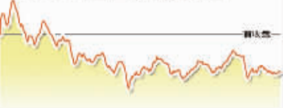
8月16日上证综指走势图