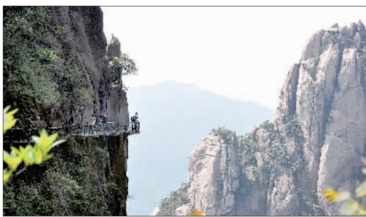
◀江西三清山景区以丰富的花岗岩造型石及独特的气候奇观，呈现出引人入胜的自然美。