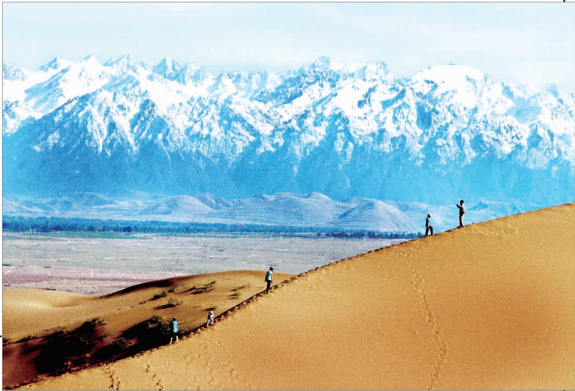
▶横亘在青海、甘肃之间的祁连山，积雪覆盖、与天相连。在它的庇护下，河西走廊形成了一个绿洲城市，产生了东西方文明交流的通道——丝绸之路。