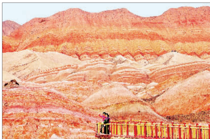
▶甘肃张掖丹霞山，七彩的颜色把沟壑、山丘装点得绚丽多姿，吸引八方游客纷至沓来。