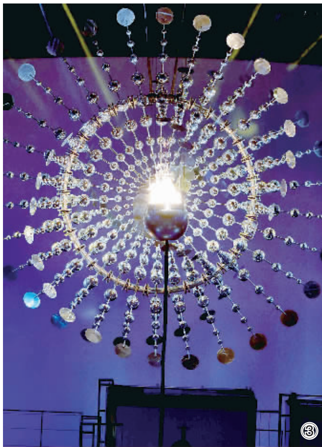
当地时间8月5日，第31届夏季奥林匹克运动会开幕式在巴西里约热内卢马拉卡纳体育场举行。主办国巴西“小预算”的开幕式以创意取胜，开幕式上体现出的绿色奥运概念给观众留下了深刻印象。