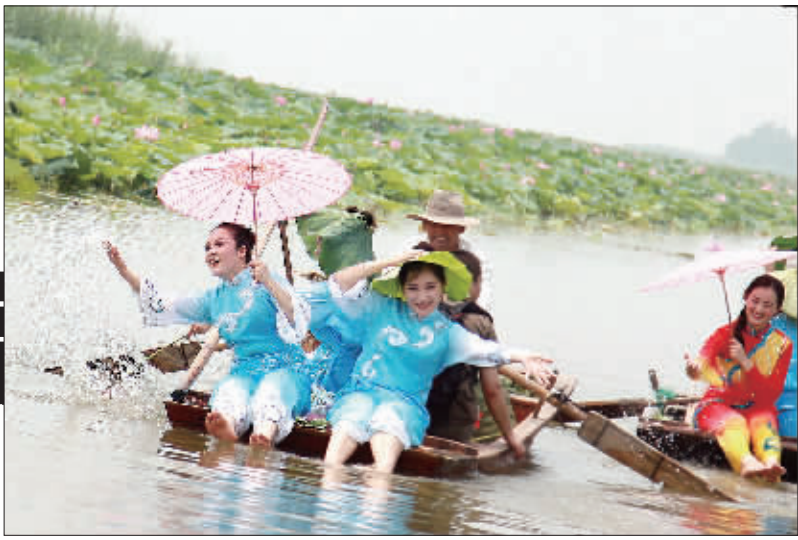
◀山东滕州微山湖红荷湿地风景区，12万亩野生荷花盛开，吸引了全国各地游客观光游玩。