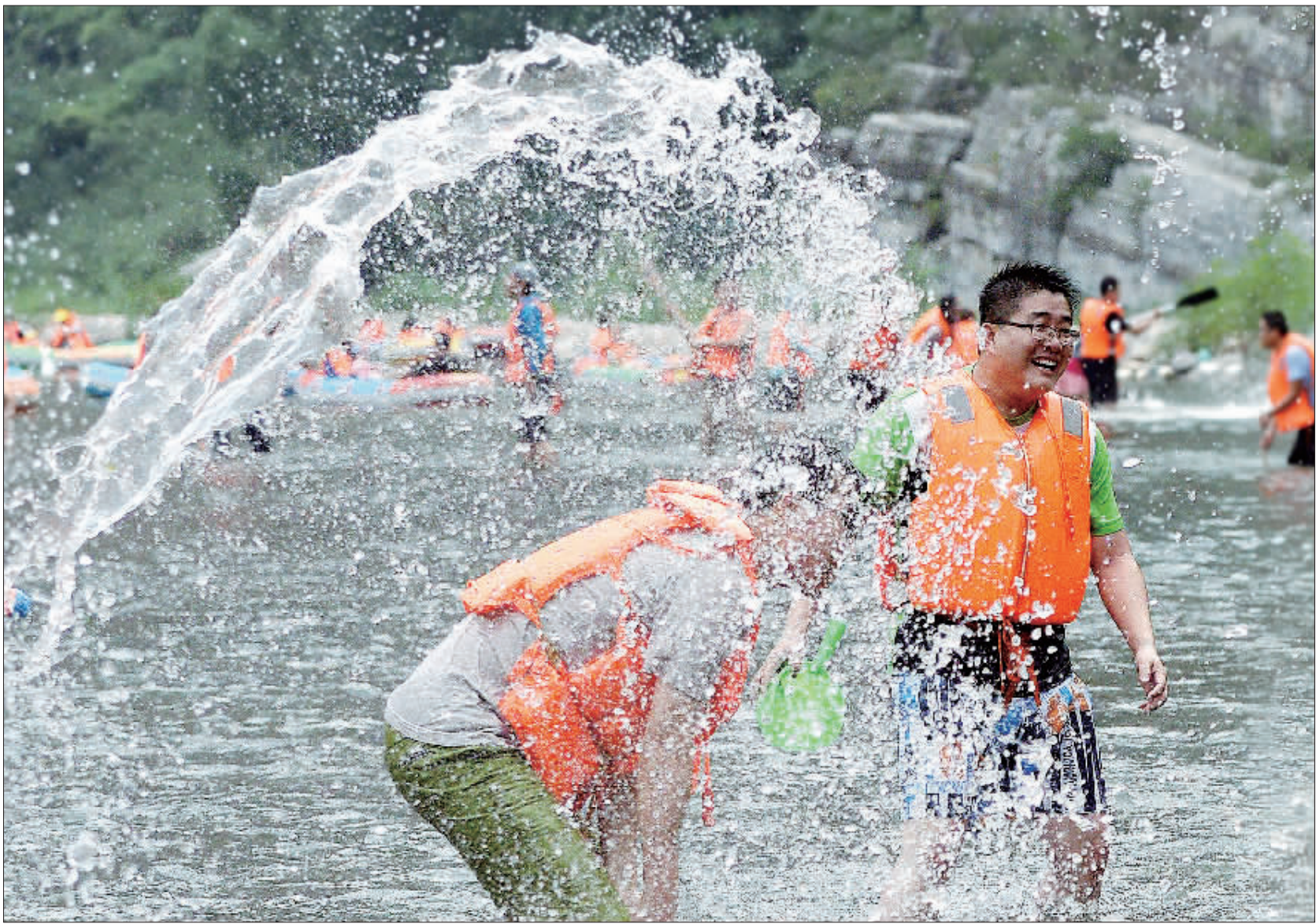
◀国家5A级旅游景区，河北保定涞水县野三坡旅游景区游人在开心戏水。针对暑期特点，野三坡旅游景区推出了主题为“享受清凉，避暑休闲”等一系列活动。