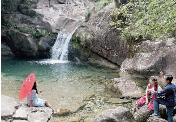
▲江西德兴市大茅山景区气候凉爽，景色宜人，吸引了大批游客前来避暑。