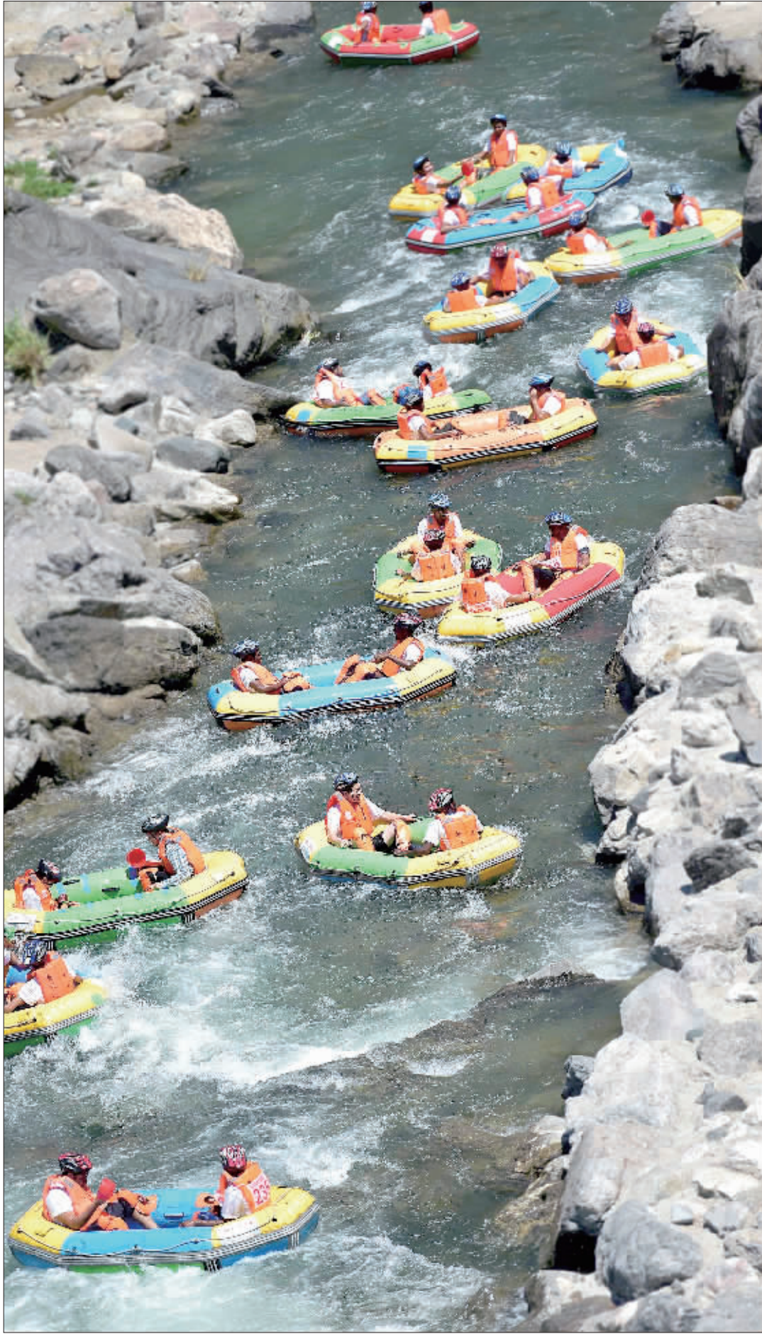
▲全国唯一的4A级漂流景区，湖北宜昌兴山县朝天吼漂流景区游客狂漂消暑。7月下旬以来，持续多日的高温天气促进了当地的漂流经济发展，该景区连续10天日接待游客上万人次。