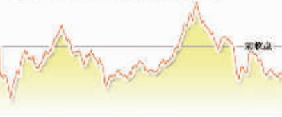
8月5日上证综指走势图