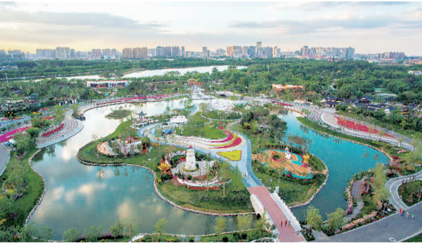
图为唐山世园会园区。