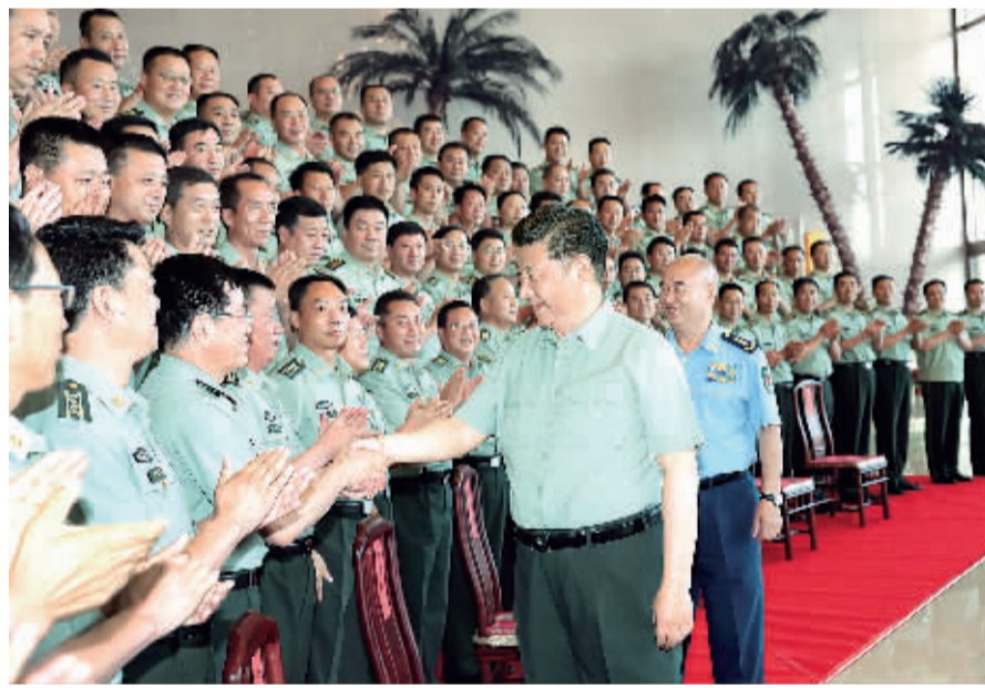
7月18日至20日,中共中央总书记、国家主席、中央军委主席习近平在宁夏调研考察。这是7月19日,习近平在银川亲切接见驻宁夏部队以上领导干部和团级单位主官,代表党中央和中央军委向驻宁夏部队全体官兵致以诚挚问候。