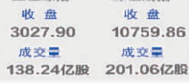
上证综指 收盘 3027.90 成交 138.24亿股