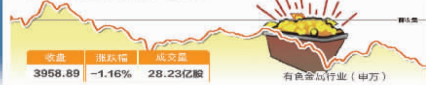
7月20日波动最大行业走势图