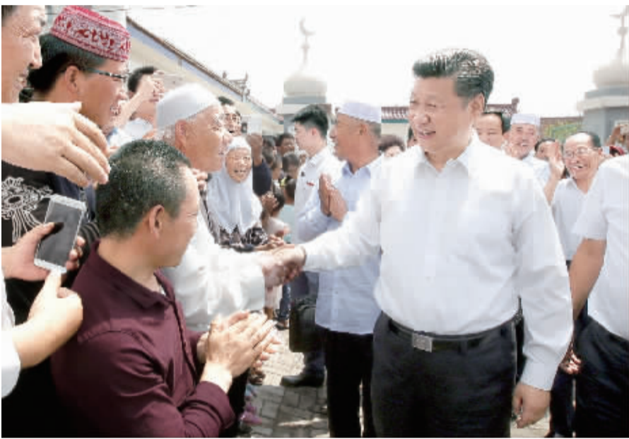
7月18日至20日,中共中央总书记、国家主席、中央军委主席习近平在宁夏调研考察。这是7月19日上午,习近平在银川市永宁县闽宁镇原隆移民村,看望慰问移民群众。