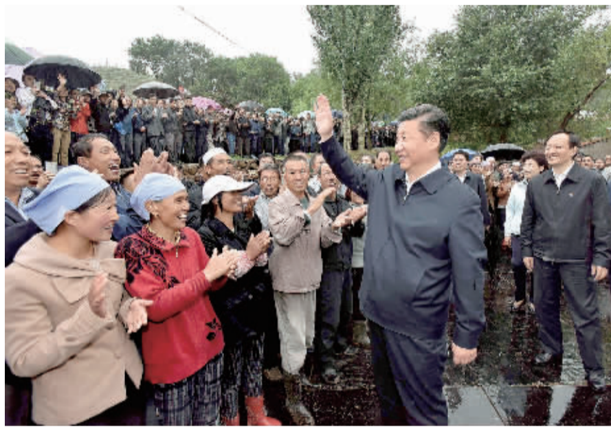
7月18日至20日,中共中央总书记、国家主席、中央军委主席习近平在宁夏调研考察。这是7月18日下午,习近平在固原市泾源县大湾乡杨岭村考察时向村民们问好。

新华社银川7月20日电 中共中央总书记、国家主席、中央军委主席习近平近日在宁夏考察时强调,到2020年全面建成小康社会,任何一个地区、任何一个民族都不能落下。要认真落实党中央决策部署,贯彻新发展理念,主动融入国家发展战略,进一步解放思想、真抓实干、奋力前进,努力实现经济繁荣、民族团结、环境优美、人民富裕,确保与全国同步建成全面小康社会。