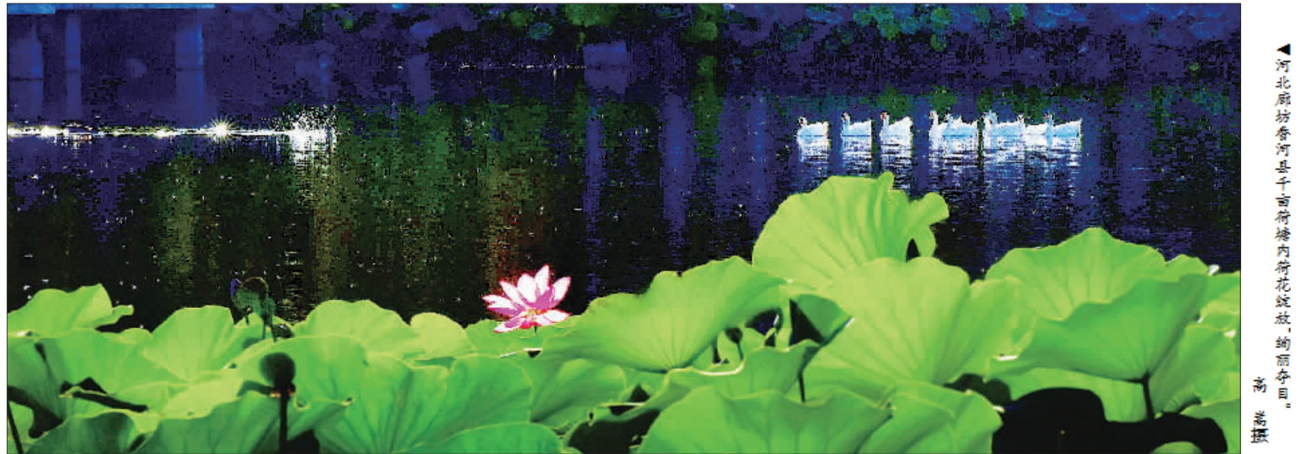
►河北廊坊香河县千亩荷塘内荷花绽放,绚丽夺目。

本版主编 李景录 编辑 翟天雪 邮箱 jjrbsyb58392306@163.com