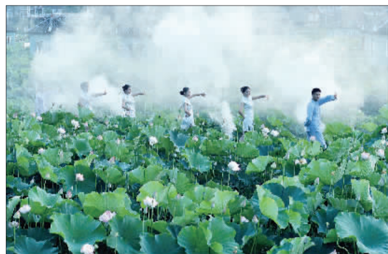
►重庆市沙坪坝区中梁镇永宁寺村2016年荷塘悦色文化节开幕。五颜六色的荷花竞相绽放,生机勃勃。