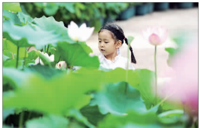
►北京莲花池公园荷花盛开,市民纷纷前来赏荷。