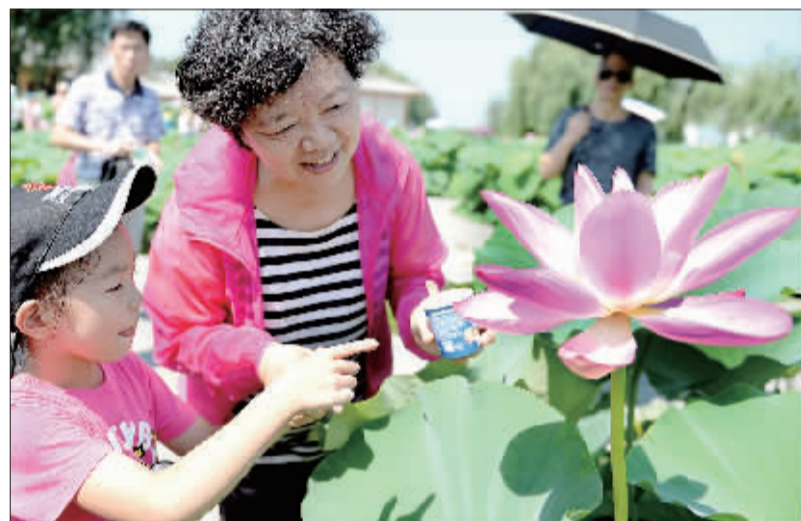
►华北明珠白洋淀景区,荷花盛开迎客来。