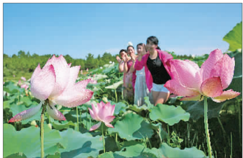
►江西吉水县醴桥镇西坑村国富家庭农场的荷花盛开,美景如画。