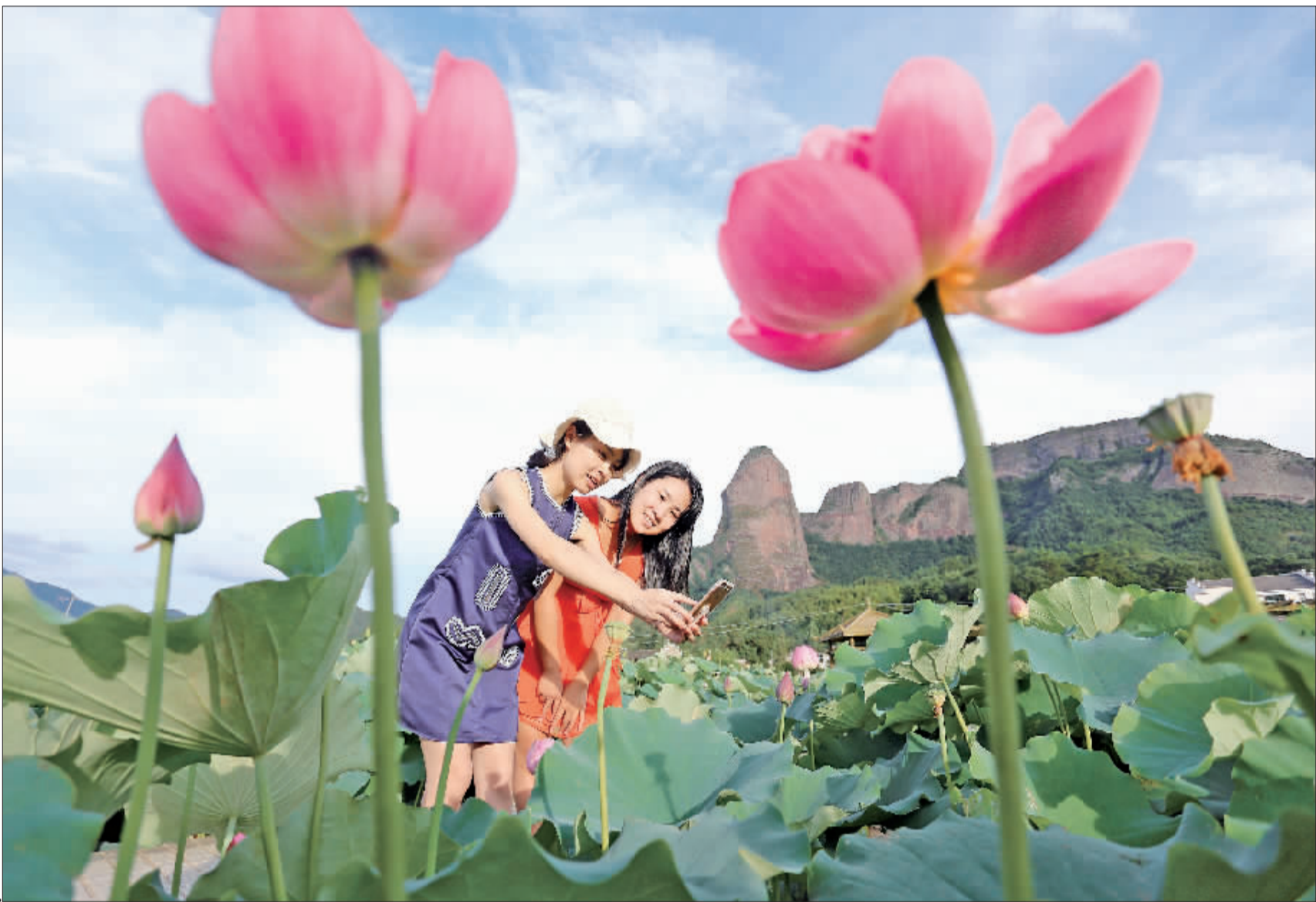
►江西石城县是“中国白莲之乡”,时下,当地10万亩荷花正在渐次绽放,吸引了全国各地游客前来观光游玩。