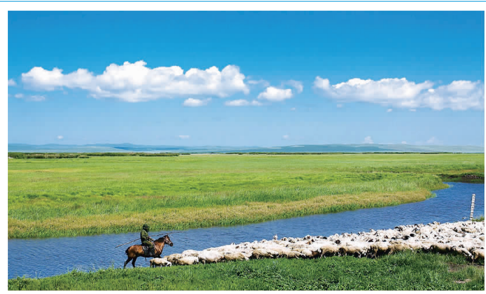
盛夏时节,内蒙古呼伦贝尔鄂温克族自治旗一望无际的大草原金花碧草,景色如画,令人陶醉。近年来,鄂温克族自治旗采取加大经费投入、扩大治沙面积、优化灌草配比、净化草原河湖、完善培训机制、调整作业时间等举措,让草原生态环境得到极大改善。