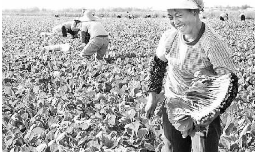
图为宁夏巴浪湖农场供港蔬菜基地。