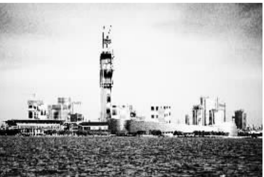
金鸡湖畔的苏州国际金融中心建成后将成为江苏第一高楼，其采用的液阻阻尼器是国内首例。“身姿”虽然挺拔，建筑的风格却与周边环境相契合。