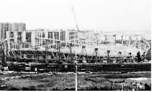
苏州工业园区体育馆采用的单层索网结构为国内最大跨度，轻盈的造型中蕴含着江南韵味。