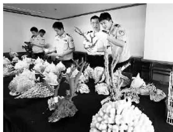
图为南京海关关属连云港海关人员正在查验近期查获的部分国家保护动植物及其制品

海关总署相关负责人表示，下一步将在继续加强国际合作的基础上，进一步强化跨区域、跨部门联动机制，加大对源头贸易、中转集散地、消费等走私产业链的打击力度，构筑起牢固的野生动植物走私犯罪防治网络体系。