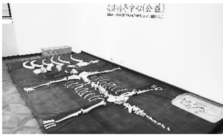
图为北京西城法院审理的“特大非法倒卖象牙虎骨狮骨案”涉案物品。(资料图片)

西城法院一审庭副庭长喻晓敏指出，珍贵、濒危野生动物是指列入国家重点保护野生动物名录的国家一、二级保护野生动物以及列入《濒危野生动植物种国际贸易公约》附录一、附录二的野生动物及驯养