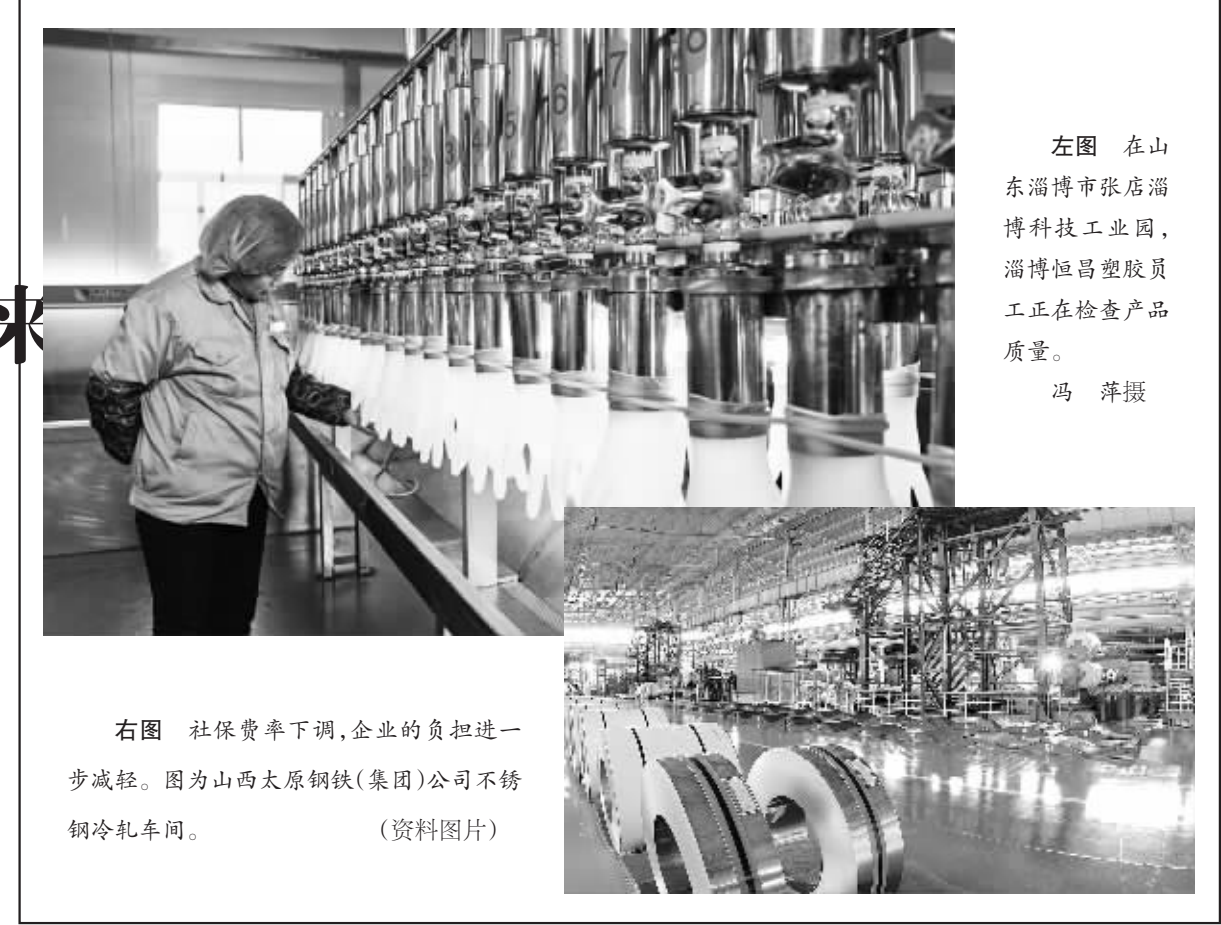
左图 在山东淄博市张店淄博科技工业园,淄博恒昌塑胶员工正在检查产品质量。

进一步降低职工社会保险费率,是否会对社会保险基金的运行产生影响?对此,上海市人社局表示,目前上海社会保险基金收支情况较好,有一定的积累且年度有结余。“降费率”是以社会保险基金正常运行为前提的,同时,上海市人社局负责人认为,进一步降低职