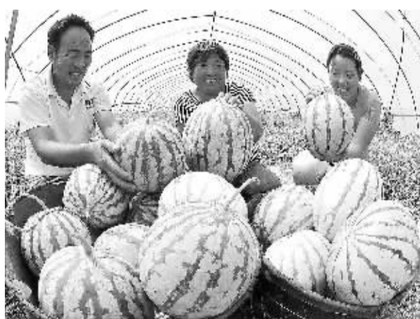
江苏东海县石湖乡大姜村帮扶贫困农民正在采摘“大姜西瓜”。近年来，该县农业资源开发局推进土地流转、农地规模经营，涌现出国家地理标志产品“东海草莓”“东海葡萄”等一大批知名农产品。