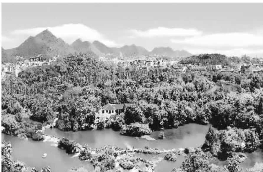
贵阳市花溪湿地公园一角。(资料图片)