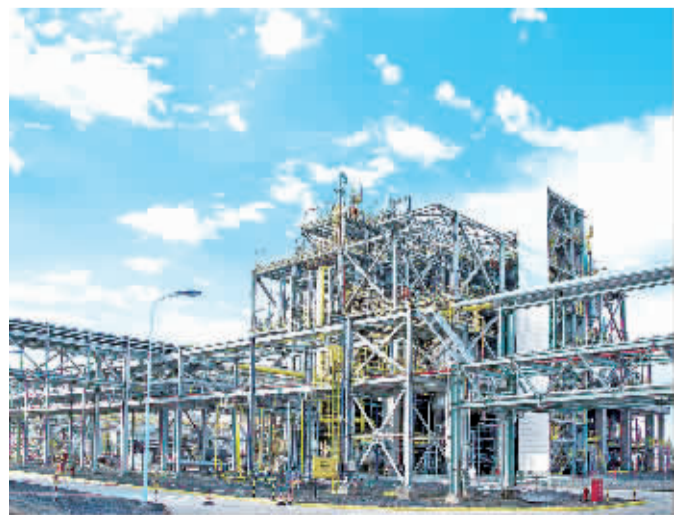
世界500强企业——德国化工企业巴斯夫集团与新疆美克化工股份有限公司(简称“美克化工”)合资兴建的新聚四氢呋喃生产装置，日前在新疆维吾尔自治区库尔勒市正式投产，新装置年产能达5万吨。图为投入运营的新生产装置。

《华盛顿邮报》的报道称，根据贝恩咨询公司发布的数据，2015年外来商品在华销量下降了1.4%，而中国本土商品的销售量上涨了7.8%。贝恩公司合作伙伴、报告合著者布鲁诺·拉纳说，中国企业生产的商品质量越来越好，越来越具竞争力。拉纳指出：“本土企业开始采用更具竞争力的方法以保住市场份额，将一些外国生产商挤出中国市场。”