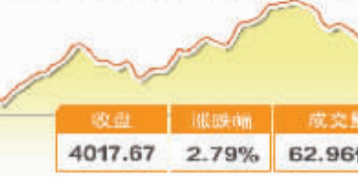
7月7日波动最大行业走势图