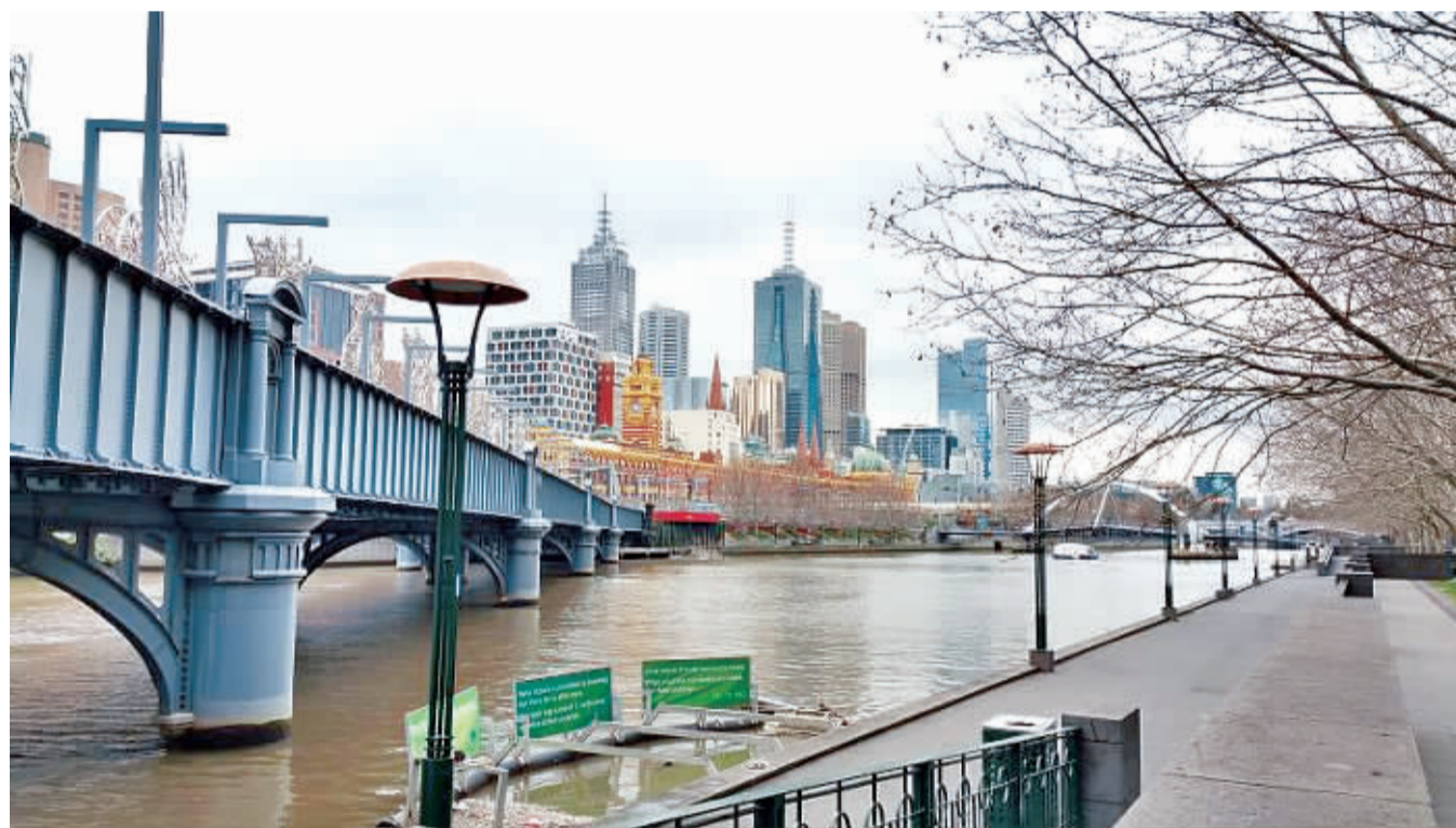
知名房地产研究机构核心信息咨询公司近日发布报告说，6月份澳大利亚各州首府房价平均增长0.5%，其中悉尼和墨尔本房价继续上涨但增速放缓。今年上半年悉尼和墨尔本房价分别上涨8.9%和5.8%，海外买家是过去3年助推澳大利亚房价上涨的主要因素。随着近期澳大利亚央行停止对海外买家发放购房贷款，再加上英国“脱欧”带来的不确定性，澳大利亚房价上涨速度放缓。图 为墨尔本市雅拉河畔。