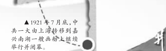
▲1921年7月底,中共一大由上海转移到嘉兴南湖一艘画舫上继续举行并闭幕。