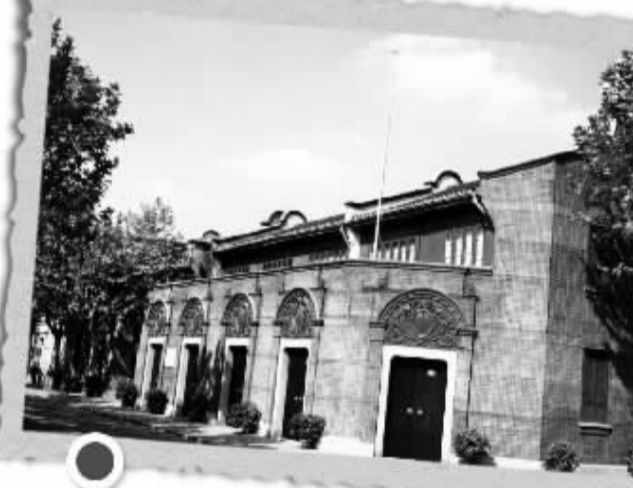
1921年7月,中共一大召开,中国共产党光荣诞生。