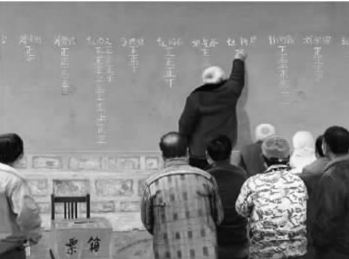
选举 郭树堂 油画 2016年