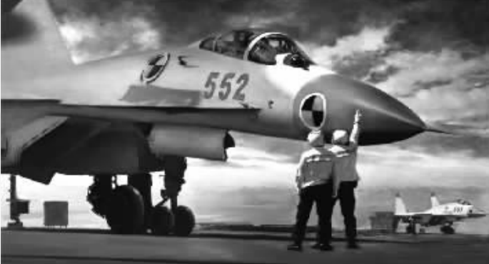
时刻准备 徐天禹 油画 2016年