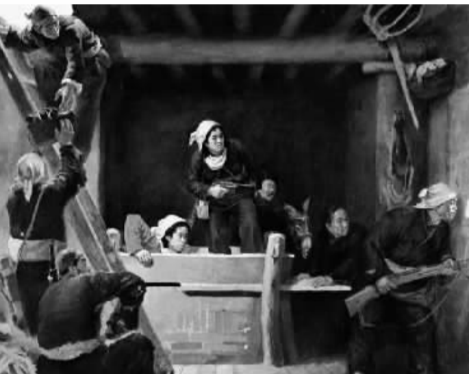
地道战 罗工柳 油画 1951年