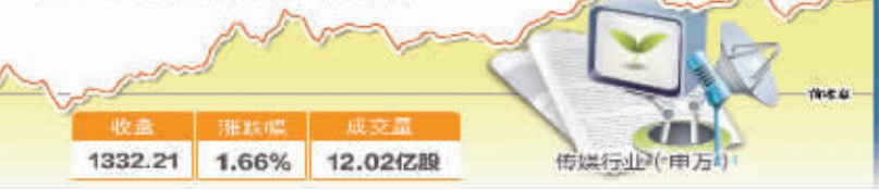
6月30日波动最大行业走势图