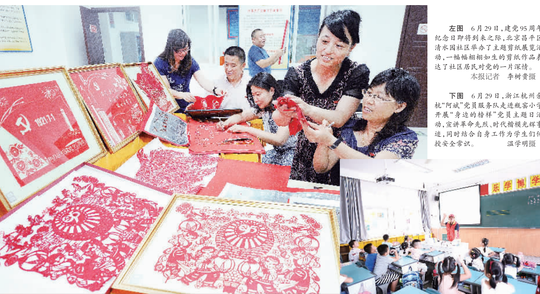
左图 6月29日,建党95周年纪念即将到来之际,北京昌平区清水园社区举办了主题剪纸展览活动,一幅幅栩栩如生的剪纸作品表达了社区居民对党的一片深情。

据新华社长沙6月30日电 (王握文 章飞钊) 国防科技大学6月30日发布消息,由国防科技大学自主设计研制、搭载长征七号运载火箭发射升空的“天源一号”卫星在轨加注实验载荷,成功完成微重力条件下流体管理与加注、高精度推进剂测量等9项在轨试验。北京航天飞行控制中心收到的遥测与数传数据表明,我国首次卫星在轨加注试验取得圆满成功。据了解,卫星在轨加注类似飞机空中加油,通过直接传输的方式对卫星进行气、液补给,可大幅延长卫星在轨寿命,提高卫星机动能力。测算表明,如果给静止轨道上的卫星补给60公斤燃料,即可延长卫星寿命12个月。因此,卫星在轨加注一直是国际航天领域的研究热点,但由于技术复杂、实现难度大,目前仅有极少数国家开展过这项试验。