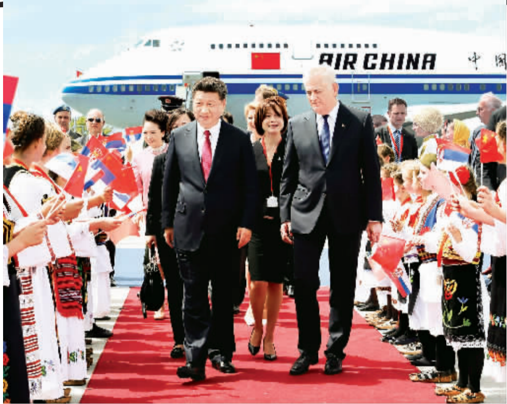
6月17日,国家主席习近平乘专机抵达贝尔格莱德,开始对塞尔维亚共和国进行国事访问。习近平和夫人彭丽媛在机场受到塞尔维亚总统尼科利奇夫妇的热情迎接。