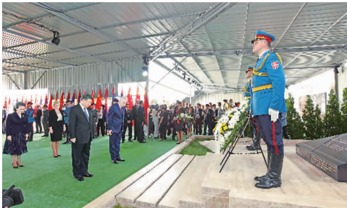
当地时间6月17日下午,刚刚抵达贝尔格莱德开始对塞尔维亚进行国事访问的国家主席习近平和夫人彭丽媛首先前往中国驻南联盟被炸使馆旧址,凭吊在使馆被炸事件中英勇牺牲的邵云环、许杏虎和朱颖3位烈士。