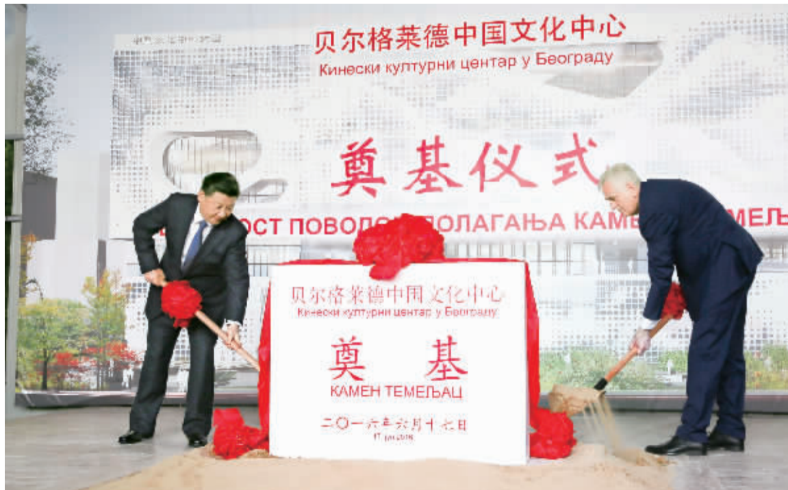
6月17日,国家主席习近平同塞尔维亚总统尼科利奇在贝尔格莱德共同出席中国文化中心奠基仪式。