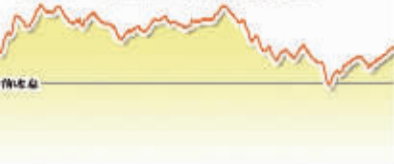
6月17日上证综指走势图