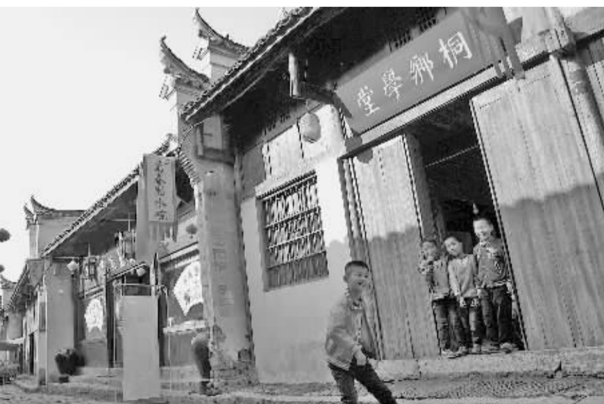
位于孔城老街街区的桐乡学堂，是孩子们诵读国学经典的好地方。