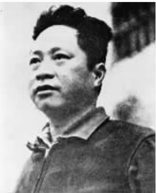
叶挺同志像（资料照片）。