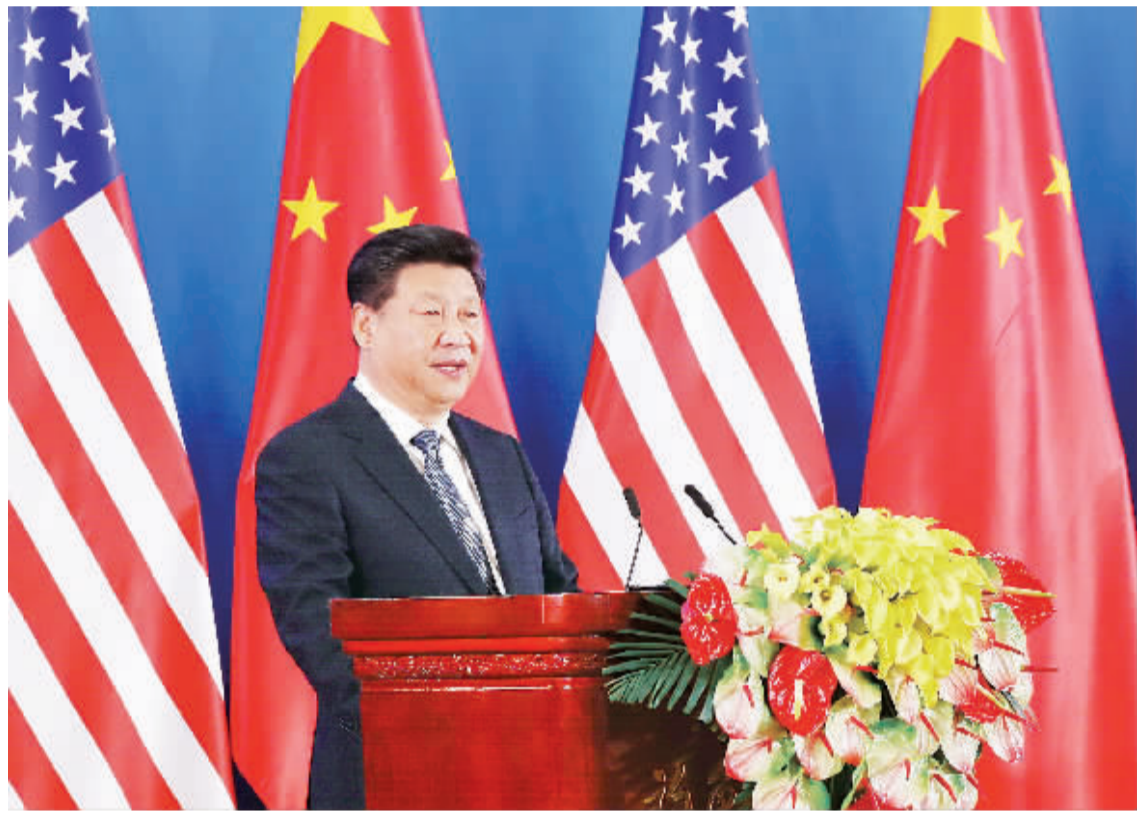
6月6日,国家主席习近平出席在北京钓鱼台国宾馆举行的第八轮中美战略与经济对话和第七轮中美人文交流高层磋商联合开幕式,并发表题为《为构建中美新型大国关系而不懈努力》的重要讲话。

习近平强调,现在世界多极化、经济全球化、社会信息化深入推进,各国利益紧密相连。零和博弈、冲突对抗早已不合时宜,同舟共济、合作共赢成为时代要求。中美要增强两国互信。要防止浮云遮眼,避免战略误判,就要通过经常性沟通,积累战略互信。我们要积极拓展两国互利合作。要秉持共赢理念,不断提高合作水平。当前要着力加强宏观经济政策协调,同有关各方一道推动二十国集团领导人杭州峰会取得积极成果,全力争取早日达成互利共赢的中美双边投资协定,深化两国在气候变化、发展、网络、防扩散、两军、执法等领域交流合作,加强双方在重大国际和地区以及全球性问题上的沟通和协调。我们要妥善管控分歧和敏感问题。中美双方存在一些分歧是正常的,双方要努力解决或以务实和建设性的态度加以