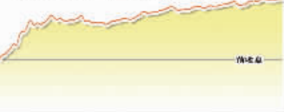
5月31日上证综指走势图