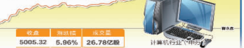
5月31日波动最大行业走势图