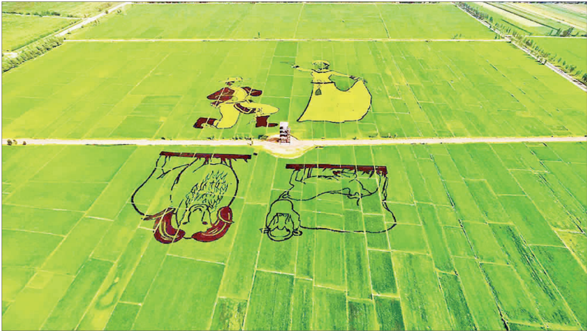
▲新疆伊犁哈萨克自治州察布查尔锡伯自治县农民在稻田里种出美丽图画。当地经过多年屯垦戍边建设，如今草肥牛壮，稻米飘香。