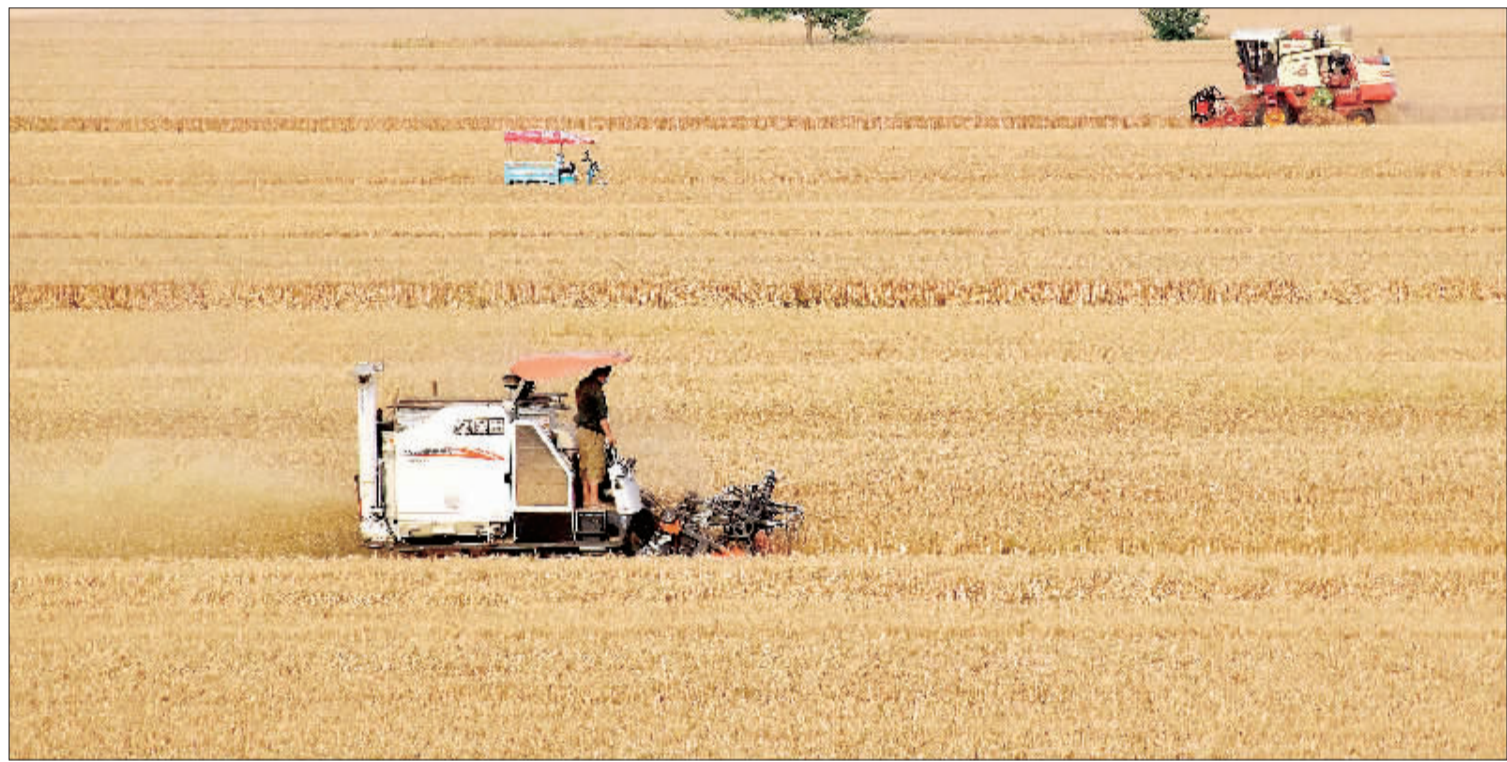
▲河南汝南县三桥镇廖屯村村民正在抢收小麦。当地抓住时机，抢收小麦，确保颗粒归仓。