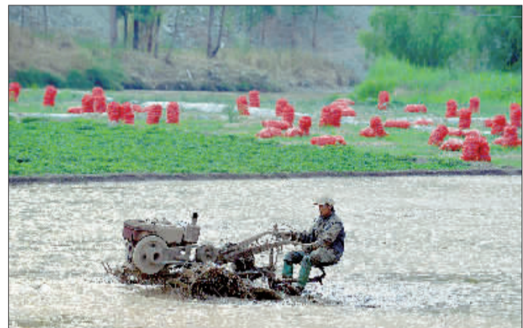
►云南昆明东川区河里湾村，农民正在水稻田里劳作准备复种。