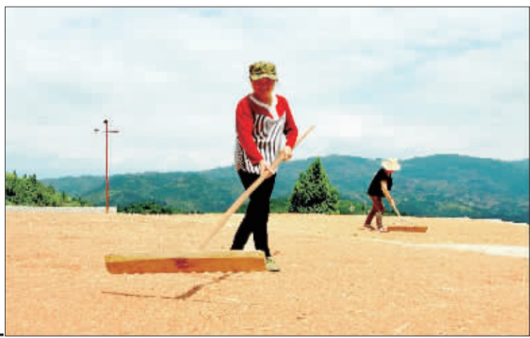
►重庆巫山县福田镇段家村村民在晾晒刚收割的小麦。今年，该县引进的小麦新品种喜获丰收。