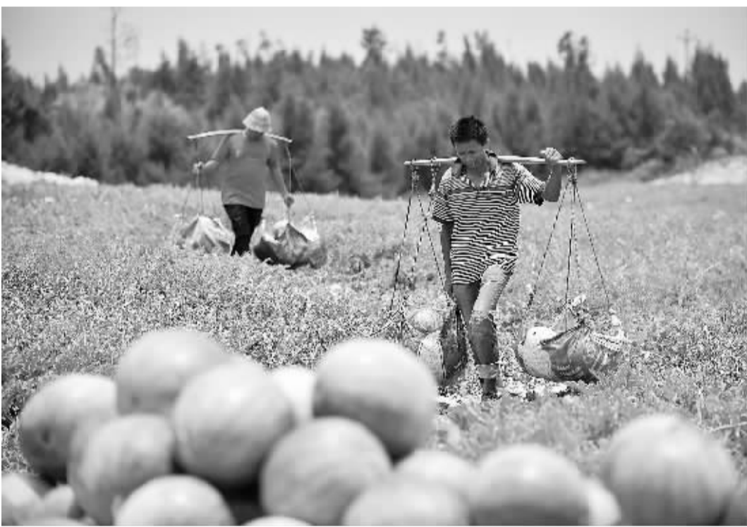
5月23日，海南文昌铺前镇林梧村的农民在田间采摘西瓜。

本报北京5月23日讯 记者吴陆收报道：在近日举行的第十九届“渝洽会”上，全球手机银行科技企业台湾太思科技与重庆两江新区管委会签约，正式落户两江新区水土工业开发区。根据协议，太思科技初期拟投资3亿元建设手机芯片生产线，开展智能薄膜SIM卡项目，年产值3亿元。