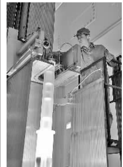
苏州吴江亨通集团员工在光纤生产车间查看光纤预制棒抽真空情况（4月15日摄）。

在国内外形势异常严峻复杂的当下，收获这样一份高“颜值”的成绩单实属不易，折射出江苏干部和企业“逆势企稳不放松、因势促变不动摇”的状态，以及力保外贸难中有进、实现经济整体转型升级的坚守，尽显江苏理性判断、奋力担当、科学转型发展的“气质”。