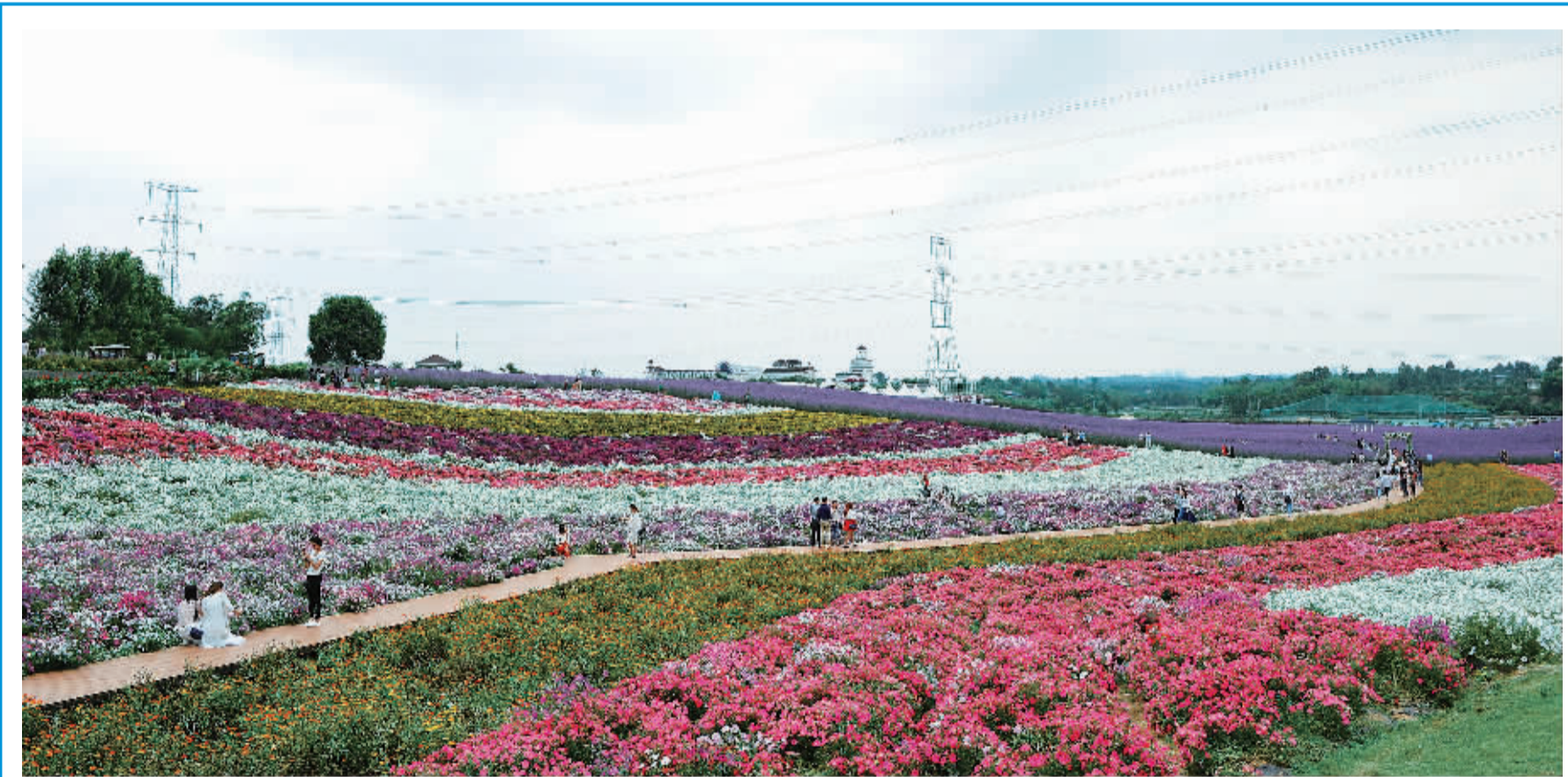
日前,四川成都市太平镇的农庄内,薰衣草、矮牵牛、马鞭草等各种花卉竞相绽放,汇成花的海洋,吸引了大批市民前来观光游玩。图为游客徜徉在太平镇农庄的花海中。