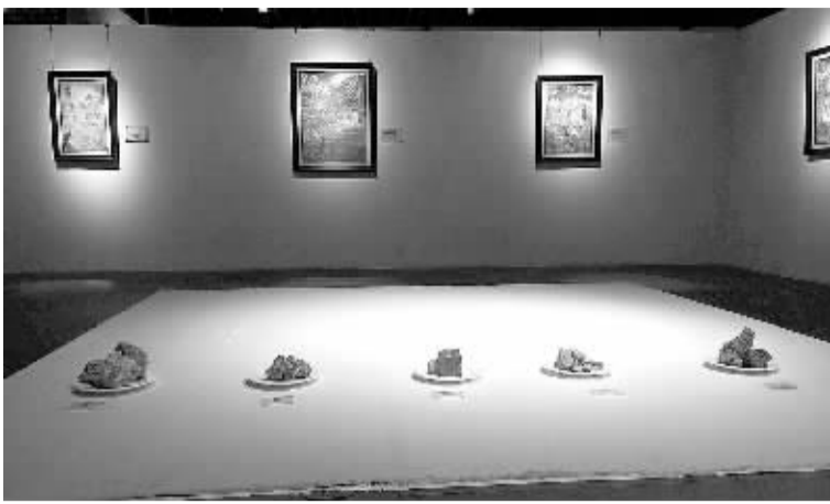
展厅中除了唐卡作品，还展出制作原料。