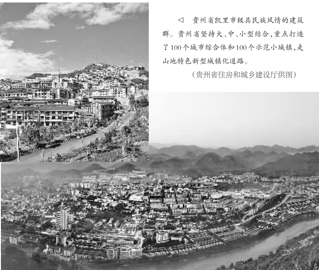
◁ 贵州省凯里市极具民族风情的建筑群。贵州省坚持大、中、小型结合，重点打造了100个城市综合体和100个示范小城镇，走山地特色新型城镇化道路。

镇的层级不同，所要建设的城市综合体的标准也不一样，而非一味地严格标准、贪大求全。