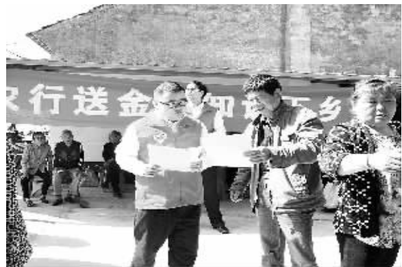
近日,农业银行江苏太仓分行联合当地基层村委会、种养合作社组织开展“农行走进农村”志愿服务,开展金融产品、种养知识宣传为主题的志愿服务。图为该行志愿者在璜泾镇永乐村向村民发放宣传资料,讲解金融知识。

截至3月末,“金融服务网格化”战略已惠及小微企业3.35万户,“三农”客户8.24万户。另据不完全统计,2015年以来发放的网格化贷款中,有3.25万笔下调利率,累计少收利息2.2亿元。