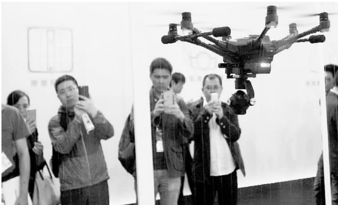
5月11日,观众用手机拍摄一款进行飞行演示的无人机。当日,第二届亚洲消费电子展在上海新国际博览中心开幕,本届展会以“互联互通”“创新”和“物联网”为主题,集中展示3D打印、机器人、智能家居、汽车技术及可穿戴设备等产品类别的技术创新。

自2002年7月由经济合作与发展组织(OECD)发起成立,FTA大会每隔15-18个月举办一次,每次主题都聚焦“税收管理方面最具挑战性”的问题。大会的议题从税务部门如何获取更多涉税信息,到打击恶意税收筹划;从研究全球财经新趋势对税务工作的影响,到降低纳税人遵从成本和企业负担,再到快速应对全球税收风险……“相比单打独斗,通力合作能取得更大成果。”曾任FTA主席的普拉温·戈丹曾这样描述大会的目标。