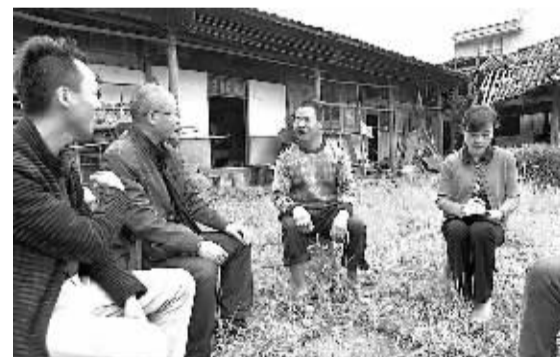
雅安市万古乡沙河村,乡政府工作人员在了解贫困户情况。