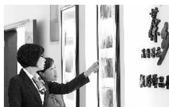
在游玩茶乡万古新村,游客在观看茶乡摄影展。