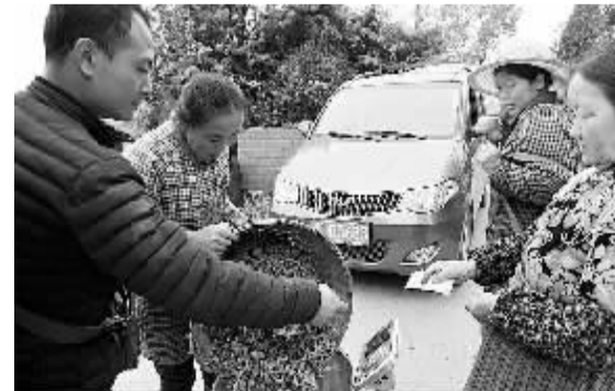
乡里的茶商到村里收茶。