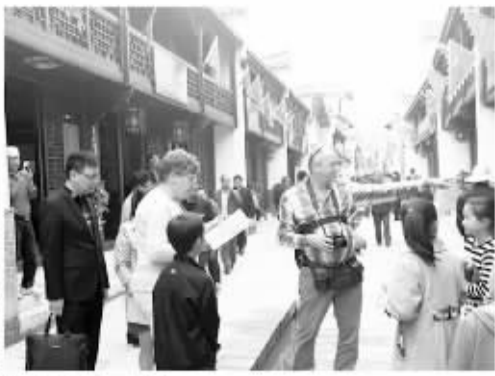
△外国游客在云盖寺镇古街游览。

为帮助居住在恶劣环境中的近300万贫困群众早日脱贫,陕西省启动了陕北、陕南大规模移民,计划用10年时间,投资逾336亿元搬迁299万人。他们因地制宜,发展特色产业,探索通过带资入股、土地流转、订单农业、园区务工等途径,让搬迁群众既搬得出又住得稳。