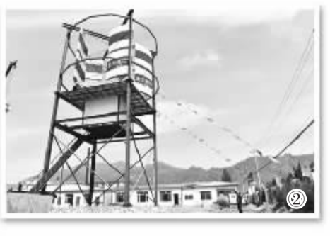
图2 由内蒙古索力德公司研发的50千瓦磁悬浮多柱塔式垂直轴风力发电机组拥有自主知识产权，可自动调节风压。