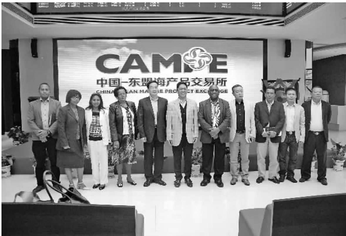
图为马达加斯加国家渔业部部长率团参观访问中国—东盟海产品交易所。

福建又是我国的渔业大省,在发展同东盟国家渔业合作方面具有良好的区位优势 and 产业基础,近年来双边水产品贸易优势互补、持续发展,2015年的进出口贸易总量超50万吨,贸易额超