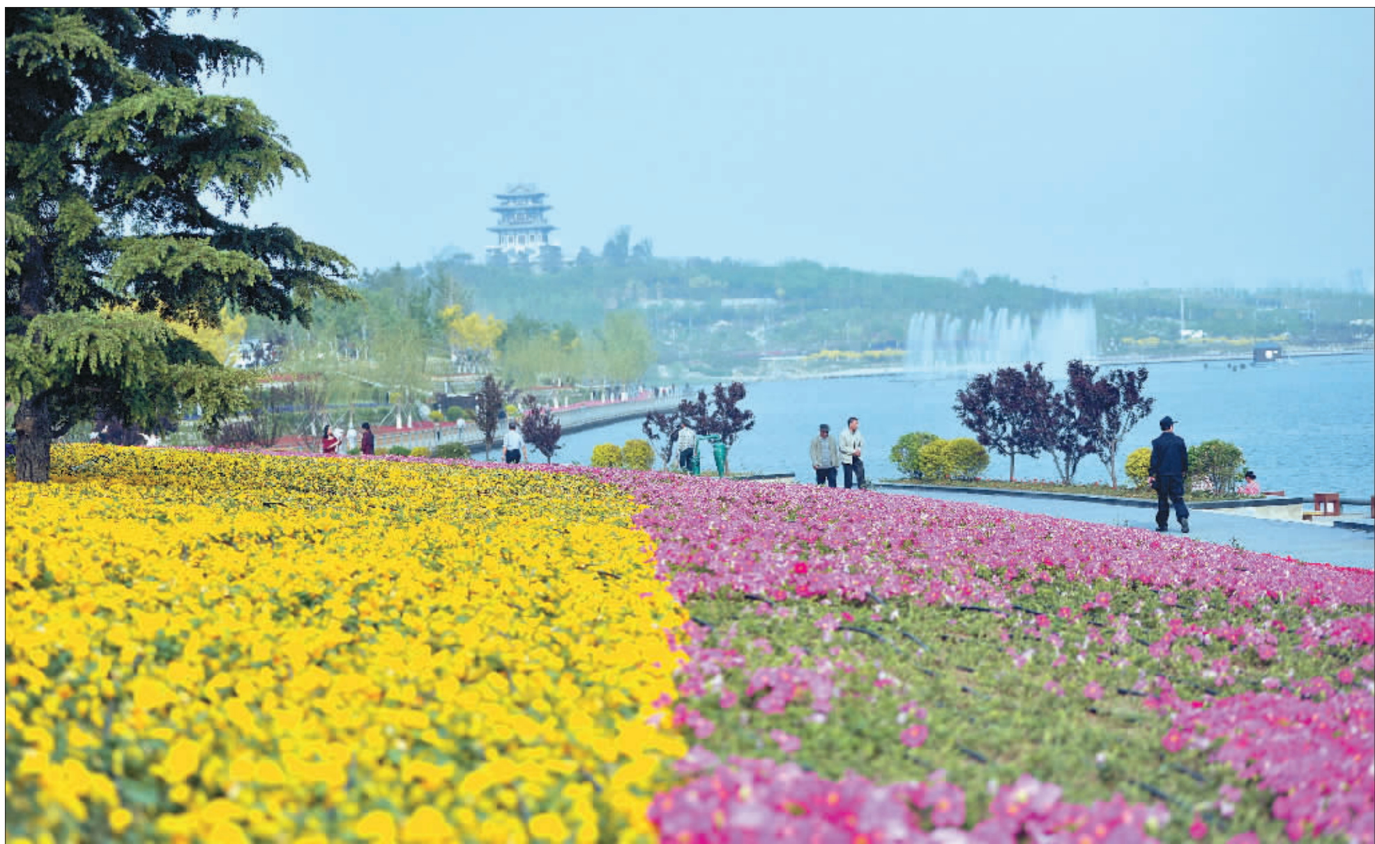
▲徜徉于河北唐山南湖生态公园,仿佛行走在画中。过去这里曾是大面积的采煤沉降区,如今呈现绿色、可持续发展的新形象。

精彩的瞬间定格,花香在纸面上弥漫,让我们一起陶醉在这花团锦簇、绿意葱茏的自然之中。