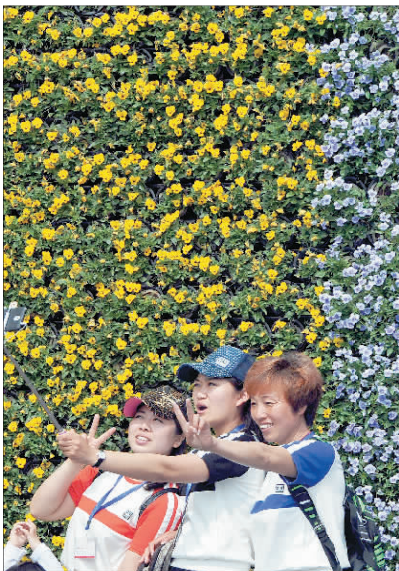
▲游客在设计师园内拍照留念。唐山世园会邀请了6名国内外知名设计师展示当代风景园林的新理念和新动态。