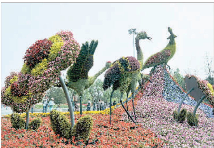
▼世园会丹凤朝阳广场上象征着浴火重生的凤凰造型,表现了唐山人民自强不息的精神风貌。