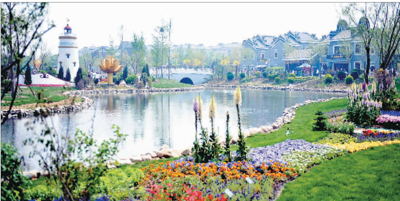
▲2016唐山世园会中的景观秉承“我的园艺我的家”的设计理念,将生态修复、花卉园艺和城市生活紧密相连。