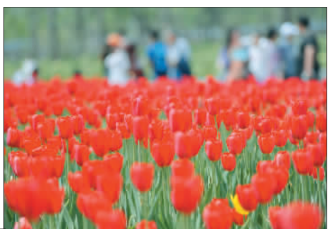
►园区内成片的郁金香美不胜收。本届世园会有417个品种、约1960万盆(株)国内外特色花卉亮相。