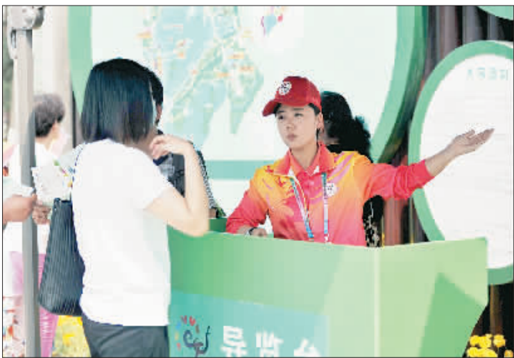
▲本届世园会将超过7万多人次的青年志愿者参与世园会园区运行及各项大型活动。