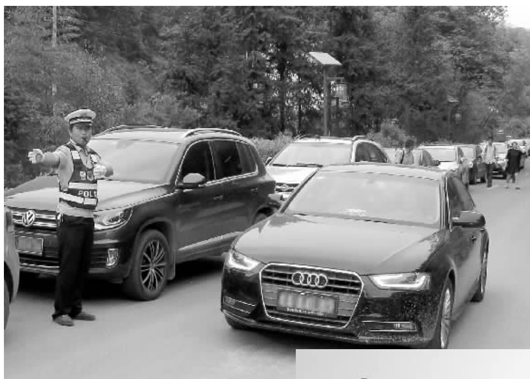
上图 “五一”期间，安徽六安市金安区公安局组织百余名民警进驻皖西大别山风情谷、悠然南山度假区、张家店战役纪念馆等当地旅游景点，维护景区治安秩序，确保观光游客的安全。图为5月1日下午张店派出所民警在大别山风情谷执勤。