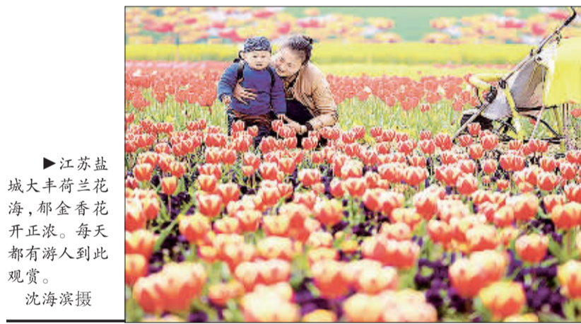
►江苏盐城大丰荷兰花海,郁金香花正浓。每天都有游人到此观赏。