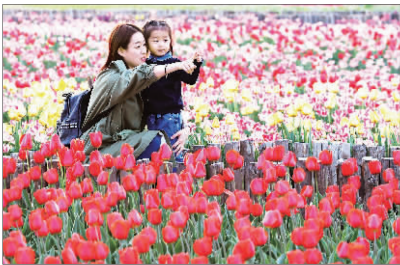
▲山东滨州市泰皇河公园,360万株郁金香争奇斗艳,吸引众多游客前来赏花。

本版主编 李景录 编辑 李树贵 邮箱 jirbsyb58392306@163.com