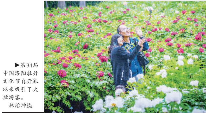
►第34届中国洛阳牡丹文化节自开幕以来吸引了大批游客。