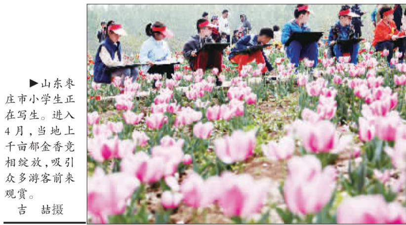
►山东枣庄市小学生正在写生。进入4月,当地上千亩郁金香竞相绽放,吸引了众多游客前来观赏。