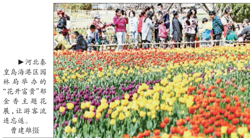
►河北秦皇岛海港区园林局举办的“花开富贵”郁金香主题花展,让游客流连忘返。