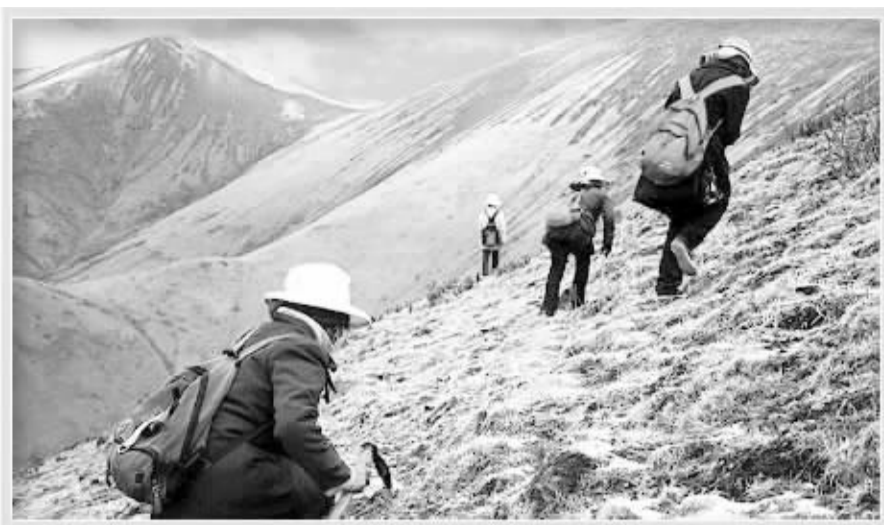
伴随虫草价格的暴涨，挖采者人数空前膨胀。由于冬虫夏草的采挖季节正是高原草甸的恢复生长期，采挖对草甸的恢复有很大影响。专家估计，若不采取有效的随挖随填措施，每采集一根虫草，至少会破坏30平方厘米的草皮，致使草地的破坏越来越严重。(资料图片)

在野外，幼虫被侵染又长成冬虫夏草的几率很低，人工培植也没有获得成功。因此，天然冬虫夏草资源很稀缺，每年全国总产量仅为80吨至150吨。随着需求增长，冬虫夏草的价格持续上升。1983