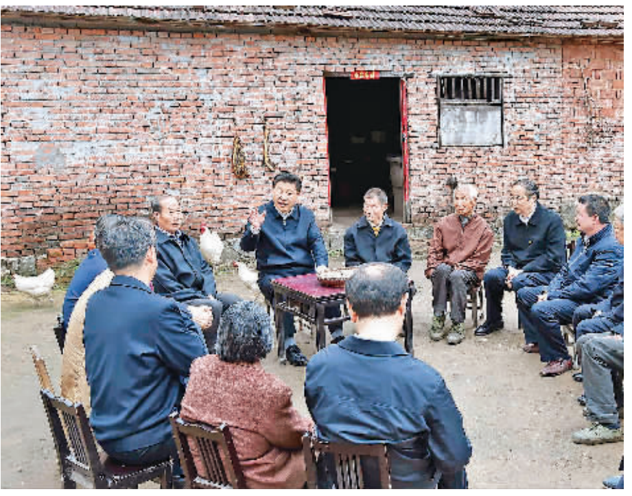
4月24日至27日,中共中央总书记、国家主席、中央军委主席习近平在安徽调研。这是4月24日下午,习近平在六安市金寨县花石乡大湾村村民陈泽家中同村民们亲切交流。