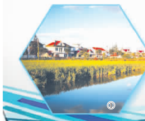
① 崇明区暨新镇仙桥村美丽乡村风景。(资料图片)

“不妨描绘一下未来。”崇明县委书记马乐声说，“如果你问我，生态岛建设最大的成果是什么，我想用最简单的语言来表达，那就是在岛上的人们能呼吸上新鲜的空气，吃上安全的农产品，过上舒适安逸的生活”。