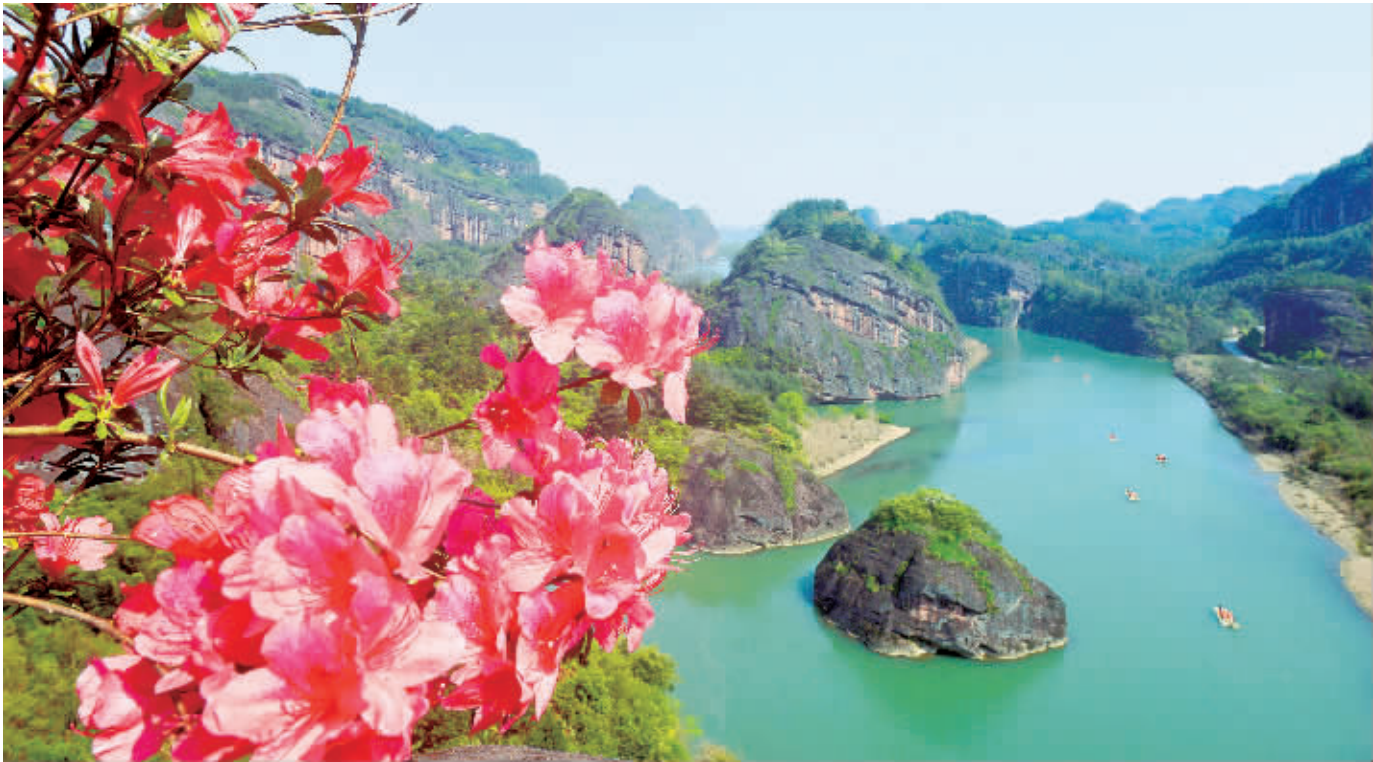
明媚春光里的龙虎山仙女岩景区。

泸溪河是龙虎山的核心旅游资源,河水清不清,关系着整个景区的“颜值”。当地政府穷尽一切办法呵护这“一河清水”,在泸溪河流域建立定期监