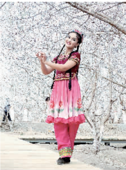
吐鲁番杏花季美丽的杏花姑娘。

如今,黄瓜山正在原有梨园的基础上,建设发展玫瑰园、葡萄园、蓝莓园等特色观光农业园,以此突破“春天看花、秋天收果”的传统模式,实现产品多样化,打造出一个“年年有节、季季有果、月月有花、天天有客”的乡村旅游目的地。数据显示,黄瓜山游客接待量已经从2009年的50万人次提高到了2015年的100万人次以上。