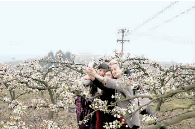
游客正在重庆永川黄瓜山梨园里拍照留念。

水大的粮食作物改为耗水少的黄花梨树。果农们尝到了种梨的甜头,口袋慢慢鼓了,黄瓜山上黄花梨种植规模也逐渐扩大。 发展并非一帆风顺。粗放式的种植,剧增的产量,以及南方优质早熟梨产业的