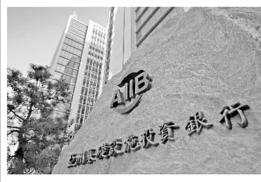
2016年1月17日，坐落于北京金融街的亚洲基础设施投资银行总部大楼正式投入使用。图为位于北京金融街亚投行总部大楼前的标识。