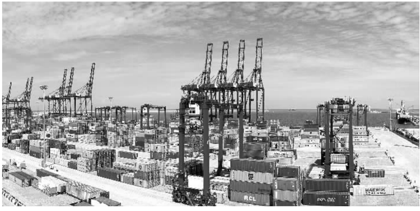
科伦坡南港集装箱码头是中国和斯里兰卡共建“21世纪海上丝绸之路”务实对接标杆性项目，是南亚最深的集装箱码头。据测算，南港码头项目在35年合同期直接税赋将达18亿美元。同时，在建设和经营期间可分别为当地创造3000个和7500个直接就业机会。图为科伦坡南港集装箱码头。

IMF副总裁朱民表示，从数据上看，服务业和消费增长强劲，人民币汇率走势趋于平稳，中国经济出现企稳迹象，令人振奋，这表明中国政府的经济刺激政策正在起作用。朱民强调，在中国经济全面企稳的局面下，应进一步通过改革来增强对中国经济的信心。