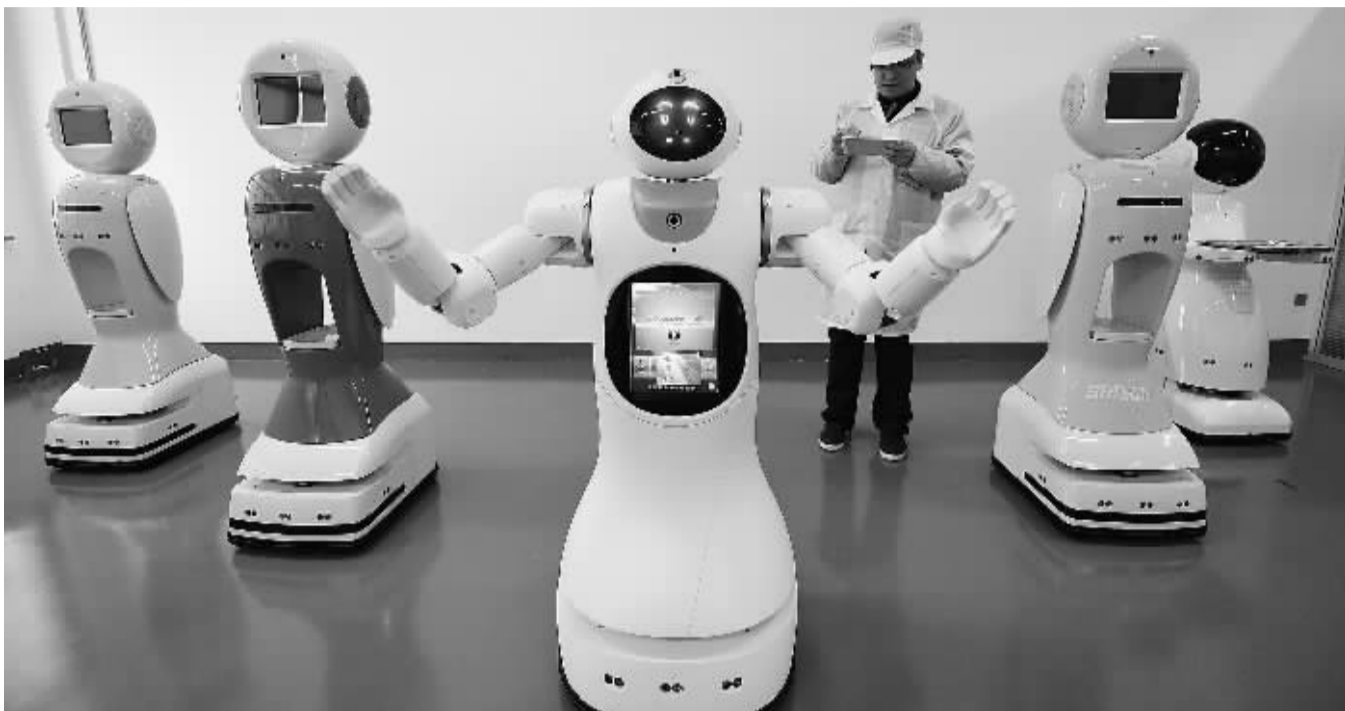
4月12日，辽宁沈阳新松机器人自动化股份有限公司的员工对准备出厂的机器人进行调试。国家统计局最新数据显示，一季度，我国战略性新兴产业增长10%，高技术产业增长9.2%。