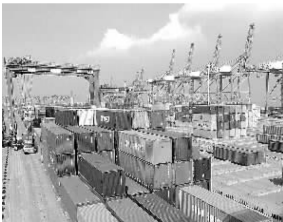
4月13日，江苏连云港港口集装箱码头一角。海关总署最新数据显示，一季度我国外贸进出口同比下降5.9%，但进口逐月回稳。

企业作为国民经济的基本单位，企业运行状况将直接影响到宏观经济的运行。要应对当前实体经济内不同行业企业分化的局面，必须加快推动供给侧结构性改革。一方面，对于一些符合产业发展方向、符合消费升级方向的企业，应该进一步加大政策扶持力度，帮助企业降低成本，支持和鼓励企业开展创新活动，为企业的发展营造良好环境。另一方面，对于一些传统的行业，尤其是一些产能过剩比较严重的行业，要注重运用市场机制、经济手段、法治办法，推动市场出清，为新动能的发展腾出空间。