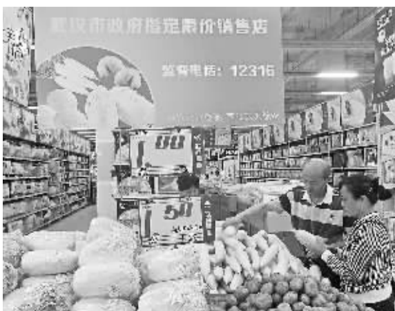
4月15日，湖北武汉市武商量贩百货店市民在选购平价蔬菜。国家统计局最新数据显示，3月份，我国CPI同比上涨2.3%。