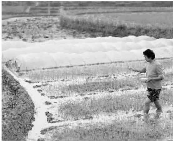
4月3日，四川华蓥市明月镇三合团村农民在给秧苗追肥。清明前后是春耕播种的大好时节，很多农户抢抓农时，抓紧播种育苗。