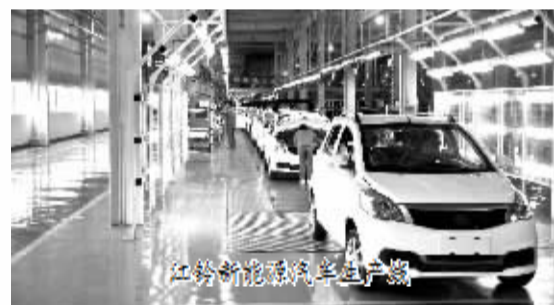
江铃新能源汽车生产