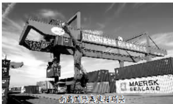
南昌国际集装箱码头