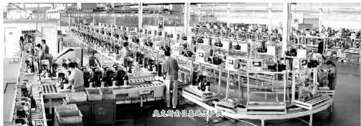
奥克斯南昌基地生产线